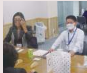
歓談する君付署長(写真左)、村田副署長(中写真)、俵統括(右写真)

今年度はコロナウイルスの関係で開催が危ぶまれていたのですが、部会長と部会員の強い思いと、税務署の広い会議室をお貸しいただくことができ、実現することができました。