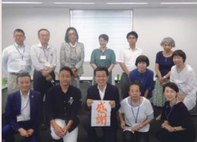
開講式に参加された方々