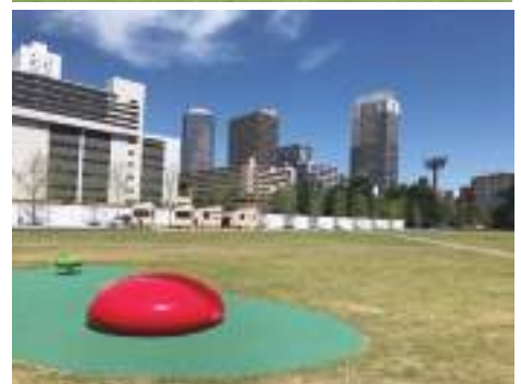
COVER PHOTO としまみどりの防災公園(愛称 IKE・SUNPARK)