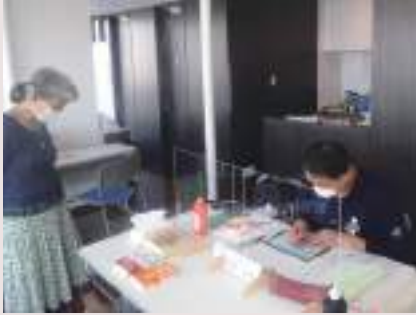
添削する波留先生