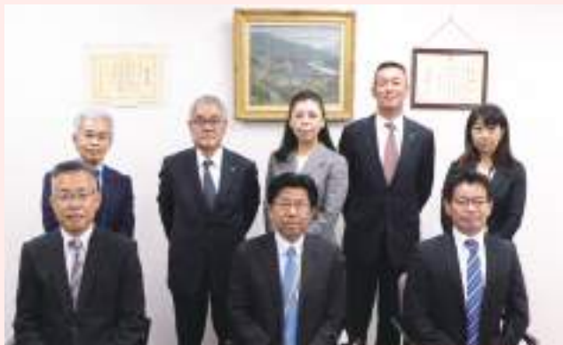
(写真撮影のためマスクを外しております)

※ICT：Information and Communication Technology (情報通信技術)