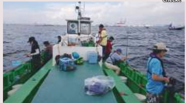
2艘に分かれ24名が参加

台風10号の影響で天気が気になりましたが、概ね晴れて海のうねりも少なく絶好の釣り日和でした。船の定員を半分以下にしてソーシャルディスタンスに気をつけながら、参加者24名は2艘の船に分かれて、深川の船着き場から横浜沖に移動しアジ釣りを楽しみました。それぞれの船の竿頭は35尾と33尾、他の参加者もまずまずの釣果で楽しい一日となりました。